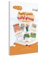
الكتاب الثالث Book ( 3 )