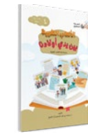
الكتاب الرابع Book ( 4 )