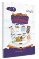
الكتاب الأول Book ( 1 )

الألعاب اللغوية بين يدي أولادنا language games at our children hands series