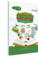
الكتاب الثاني Book ( 2 )